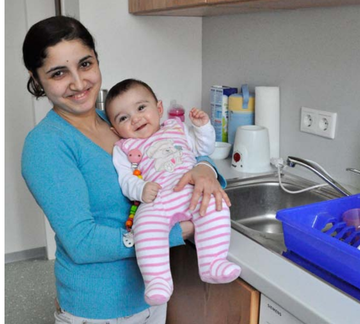
Die Küche im Mutter-Kind-Haus des St.-Lioba-Zentrums – finanziert von der CaritasStiftung. Hier leben junge Mütter, die aufgrund familiärer oder sonstiger Probleme besondere Unterstützung brauchen.