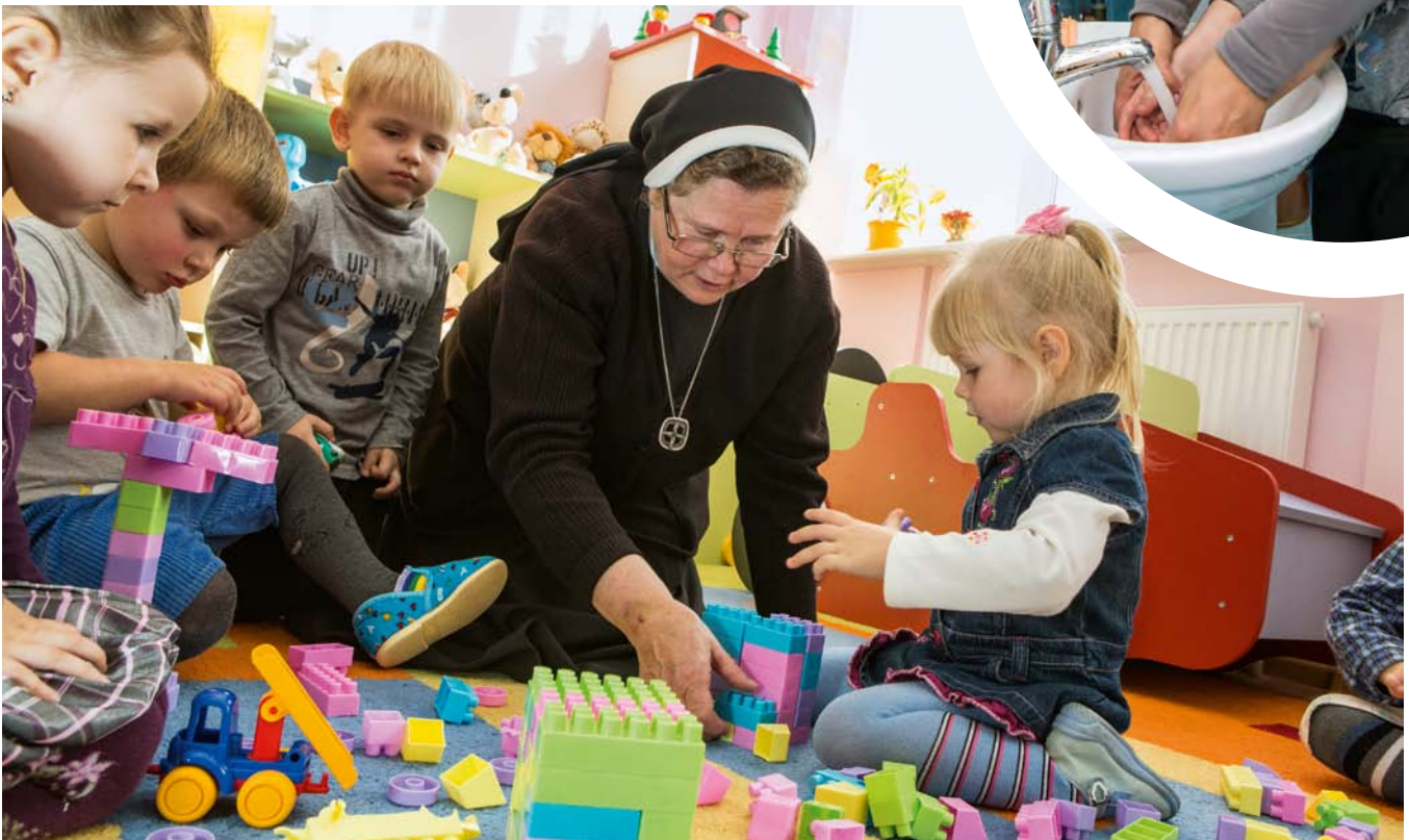
Das Kindersozialzentrum der Caritas Kaliningrad in Mamonowo (Heiligenbeil) bietet pädagogische, psychologische und materielle Hilfe für Kinder: Das Zentrum ist mit Hilfe der Caritas im Erzbistum Paderborn errichtet worden und vereint ambulante, stationäre und teilstationäre Dienste.